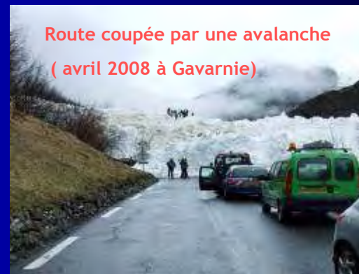
Route coupée par une avalanche ( avril 2008 à Gavarnie)