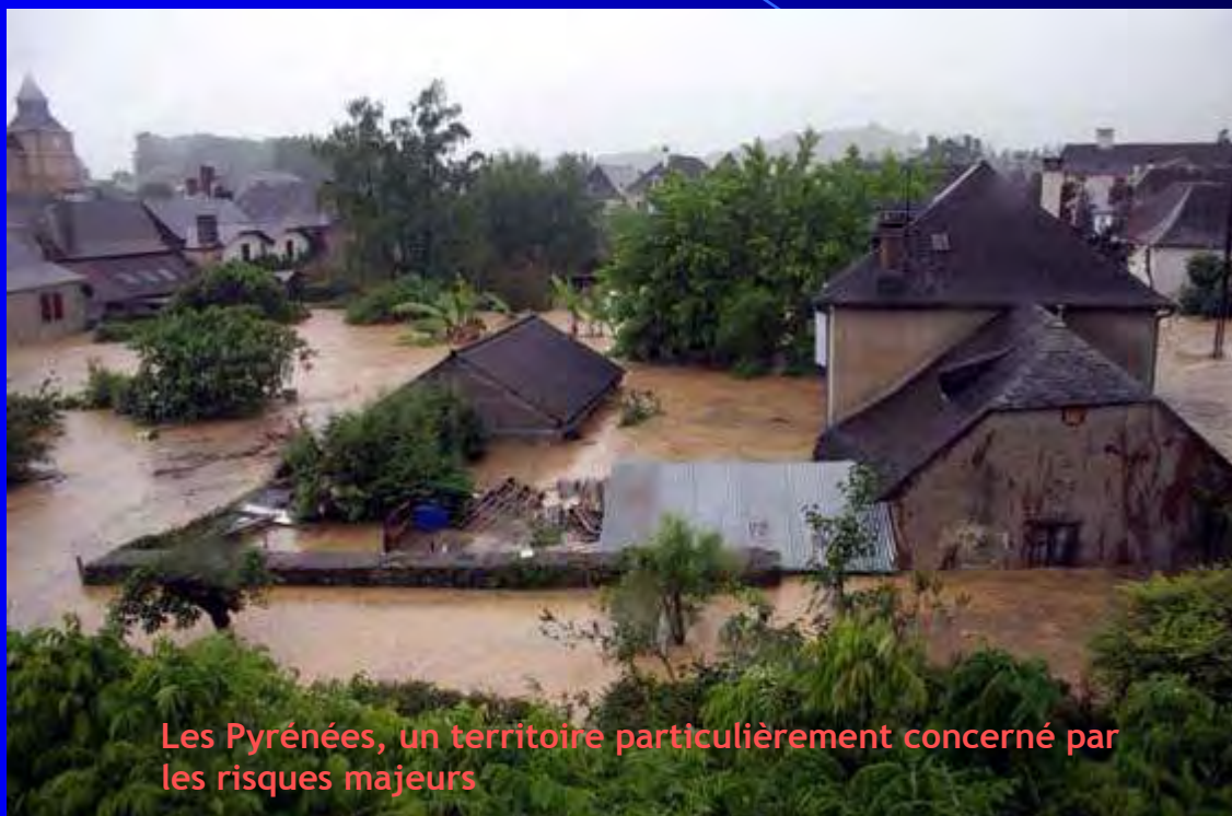
Les Pyrénées, un territoire particulièrement concerné par les risques majeurs

FORUM D'INFORMATION SUR LES RISQUES, EDUCATION ET SENSIBILISATION