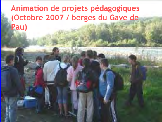
Animation de projets pédagogiques (Octobre 2007 / berges du Gave de Pau)